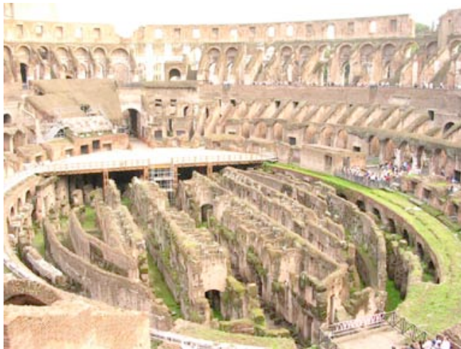
Intérieur du Colysée, Rome