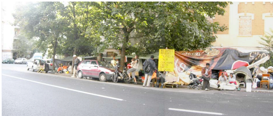
Trottoir de Via Sannio, une semaine après l'expulsion.