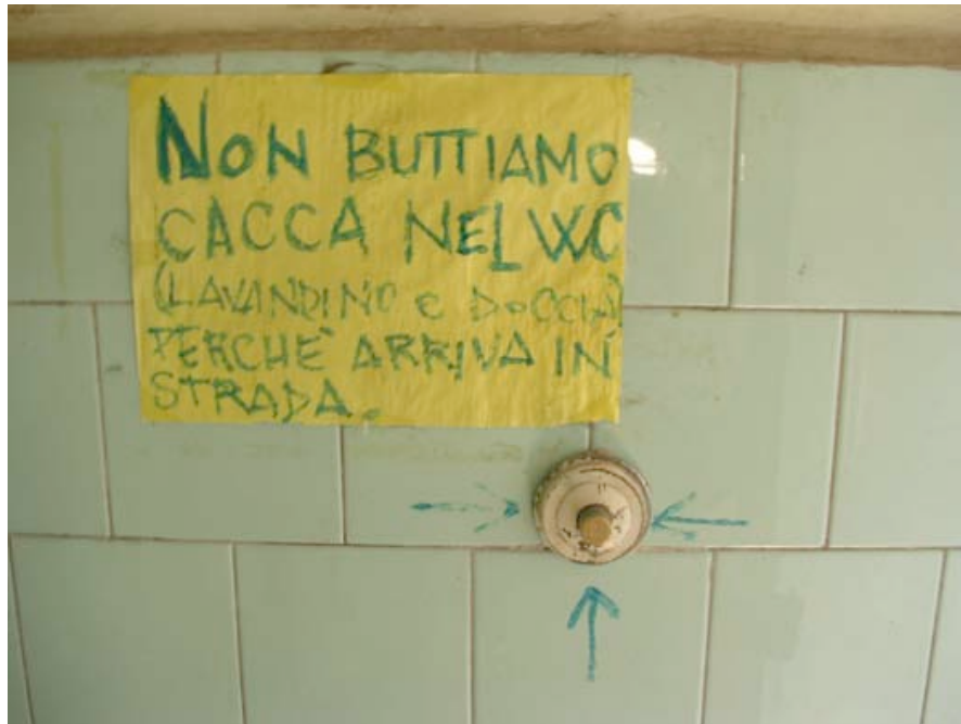
Affiche dans les sanitaires communs.

Les travaux sont faits en fonction de l'état existant. On creuse, on trouve un tuyau et on le tord pour qu'il corresponde à l'embranchement de l'évacuation. Ici, tout est bien tant que ça fonctionne.