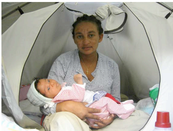
Un nouveau né et sa mère, sous une tente installée sur le trottoir.

Tous sont en possession d'une carte de réfugié (accordée aux personnes reconnues comme telles selon la convention de Genève en 1951 ) ou d'un permis de séjour pour asile politique. Tous sont donc sous la protection de l'Etat, mais que fait-il pour eux ? Ils rêvent d'aller en Angleterre, où la situation pour les réfugiés est meilleure. Mais ils ne peuvent, étant fichés en Italie. Ils souhaitent quitter ce pays d'« accueil », qui les ignore. Mais, l'Italie n'annulera pas leur carte de réfugiés et n'effacera pas leurs empreintes. La seule solution serait que « les personnes se réclament de nouveau de la protection des autorités de leur pays d'origine » ou bien que « les circonstances leur ayant permis d'obtenir le statut de réfugié "aient cessé d'exister". »(clauses de cessation (art. 1-C, 1 à 6))