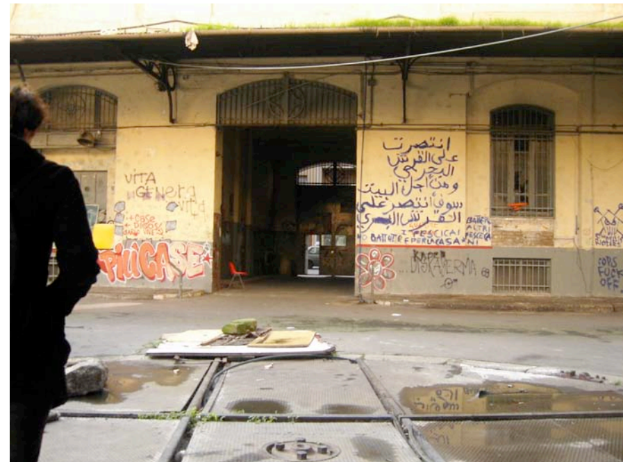
Vue de l'entrée depuis la cour de l'occupation

"Ne jetons pas le caca dans les WC (lavabo et douche) parce que cela arrive dans la rue". Cette affiche, vieille de deux ans, montre que l'absurdité de la situation, non sans un certain humour !! A certains endroits de l'occupation, les travaux ont été fait dans l'urgence, sans prendre le temps de chercher à différencier les différents réseaux d'eau par exemple. Ainsi, par endroit, les eaux sales se déversent rejoignent les eaux pluviales.