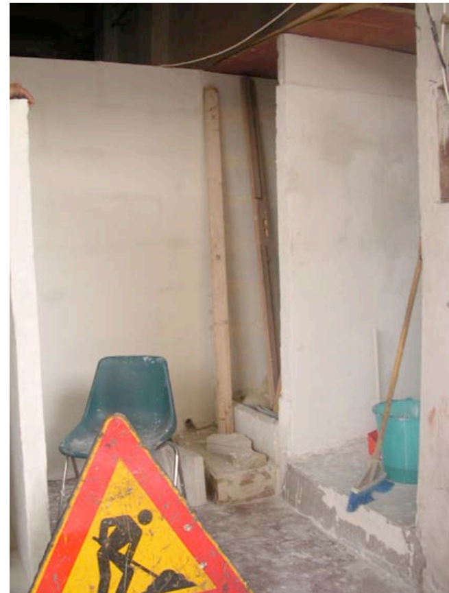
Après l'élévation de deux murs, avant la pose de carrelages.

Je souhaite continuer à travailler sur l'habitat informel, que ce soit des occupations ou bidonvilles, là où le rôle de l'architecte n'est pas de créer un objet, mais plutôt travailler sur les processus de projet et la transformation des modes d'habiter, en concertation avec les habitants.