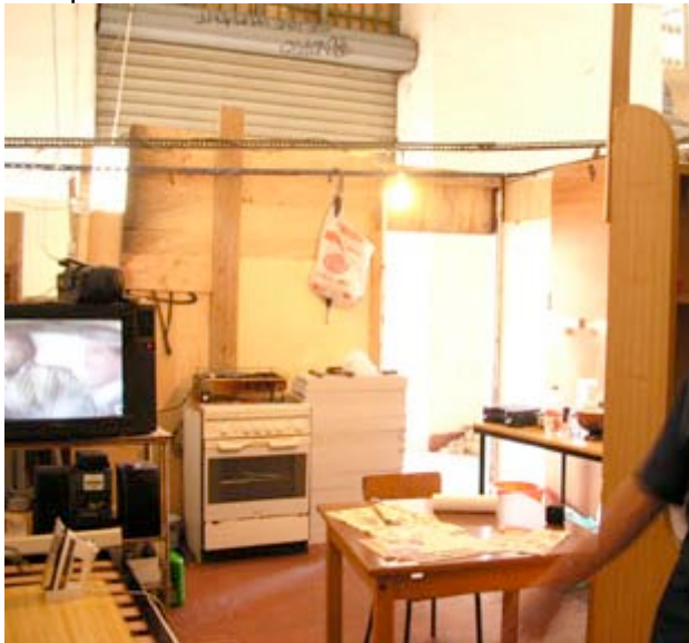
Intérieur de la casa d'Aziz, cuisine et salon, vue vers l'entrée

Aziz, un des habitants de Porto Fluviale depuis le début de l'occupation, est marocain. A 40 ans, avec sa femme et son fils restés au Maroc, il n'est qu'un exemple (parmi tant d'autres) de la situation difficile que doivent vivre une partie des immigrés économiques qui viennent en Italie.