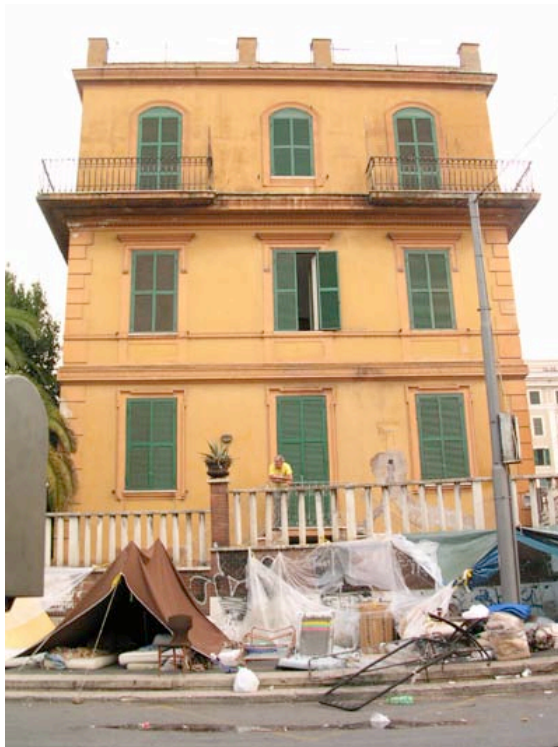
Tentes installées au pied du bâtiment anciennement occupé.

Elle a commencé dans le calme, personne n'opposant de résistance. Mais la Commune n'ayant pas prévu de solution alternative, pas de propositions de relogement, les femmes ont alors commencé à entonner, tranquillement, quelques slogans, pour protester contre la situation. La réaction des policiers fut violente : ils ont enfermé les personnes dans deux camions, desquels on entendait seulement les hurlements. Deux demandeurs d'asile se sont retrouvés à l'hôpital, suite à des coups reçus alors qu'ils protestaient contre un policier qui avait mis les mains sur une des femmes.