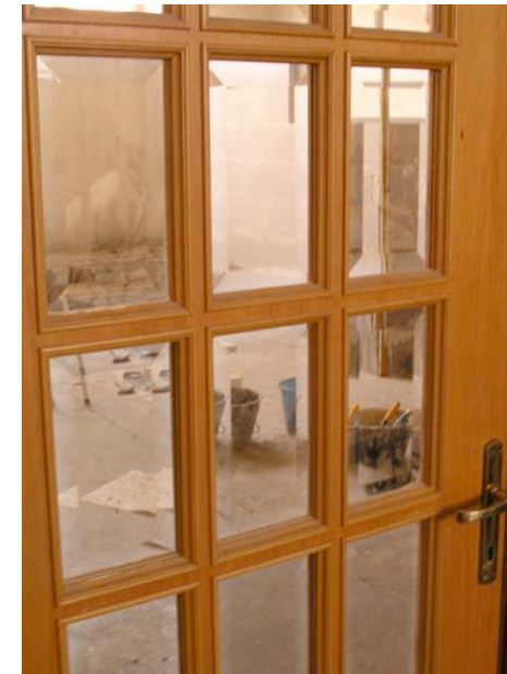
Porte d'entrée d'une habitation

Le bas des cages d'escaliers est devenu l'endroit où s'entrepasse tout le mobilier qui ne sert plus, en attente d'être emmené à la décharge. Le monticule grossit peu à peu, personne ne voulant s'en charger, car "personne n'a jamais rien jeté là-dedans". Il a été sujet de discussions très animées lors d'assemblée. En plus d'être un concentré de matériaux inflammables dans une cage d'escalier, il est aussi très dangereux pour les enfants qui l'escaladent en allant chercher le ballon. Les habitants se rejetant la faute, aucune décision efficace n'a pu être prise pour l'instant.