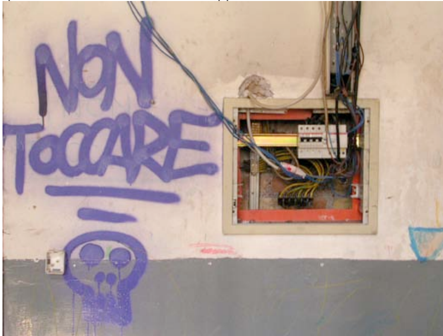
Ne pas toucher : tableau électrique d'un étage (30 familles) de l'occupation

avec chambranle branlant, ces portes sont l'interface entre l'occupant et le visiteur, le seuil, la limite entre l'espace "privé" (si tant est que la notion de privacité existe dans cette occupation) et l'espace semi privé (le couloir de desserte des différentes habitations, qui est assez large pour être un lieu de rencontre, où l'on s'arrête volontiers pour discuter). Cette porte neuve, vitrée, fait office d'exception dans le couloir. La vue a vite été obturée, dès que les travaux à l'intérieur de l'appartement se sont finis.