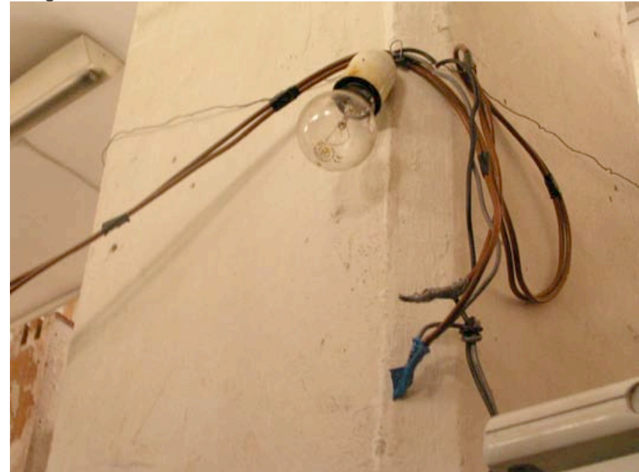
Fils électriques scotchés à l'intérieur d'une habitation.

mais cela insinuerait une organisation et un accord entre tous les habitants, ce qui est loin d'être le cas (mettre 250 personnes d'accord est assez compliqué). De plus, le système actuel permet à chacun d'aller chercher un minimum d'électricité, limitant les dégâts. Si le système est remanié, mis aux normes, cela impliquerait un voltage plus conséquent dans les fils de distribution, et insinuerait que tout manquement à la règle serait beaucoup plus dangereux.