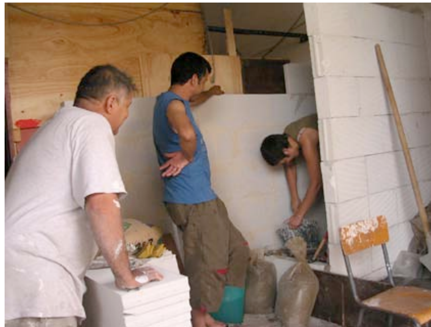
Travaux en cours : construction du mur pour les sanitaires

Cette expérience s'est révélée particulièrement difficile sur le plan émotionnel, puisque je n'avais aucune légitimité lorsqu'il s'agissait d'intervenir lors de ces débats.