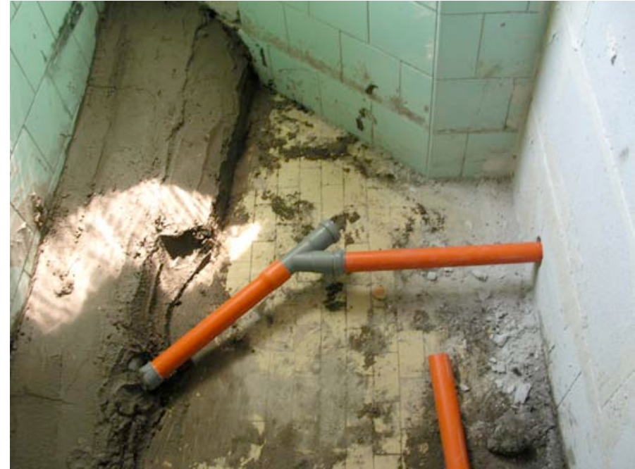
Travaux de raccordement aux descentes d'eaux usées dans les sanitaires.

demander aux autres s'ils peuvent utiliser la machine, lorsqu'elle ne tourne pas. Ces machines sont donc devenues un signe de puissance, de richesse, car c'est un des seuls luxes permis ici.