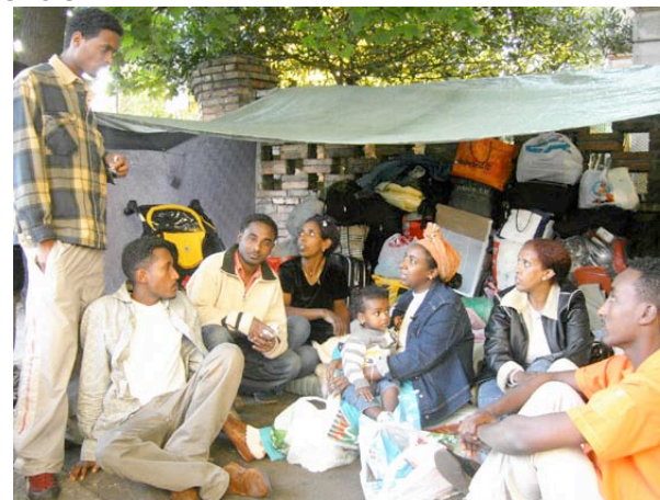
Campement dans la rue, avec femmes et enfants, jusqu'à ce qu'une solution (provisoire) soit trouvée.

Aucune association n'est présente sur les lieux. Quelques unes sont passées voir la situation, parmi lesquelles Caritas, MSF, Forum, et ACTION, mais sont dans l'impossibilité d'agir, tant ces situations d'urgences sont nombreuses, et les listes d'attentes, pour obtenir des tentes et couvertures, interminables. Chacun se relance les responsabilités. C'est la politique de la « patate chaude ». La seule solution proposée par la Commune était de reloger, les femmes et enfants dans différents centres d'accueil, dispersés dans la ville. Mais comment peut-on accepter de séparer des familles, alors que c'est tout ce qu'il leur reste. Ils n'ont plus de nation, de parents, de terre, plus rien. Ils ont déjà dû abandonner leur famille dans leur pays d'origine, comment peuvent-ils se séparer des leurs encore une fois.