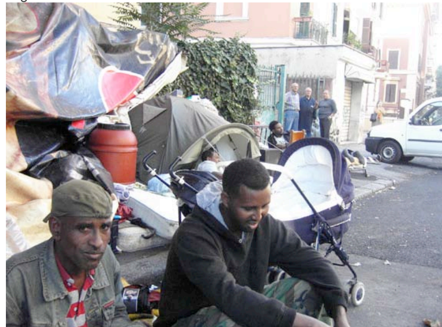
Après-midi sur le trottoir, sous le regard du voisinage Les conditions sanitaires étant déplorable, la croix rouge intervient tous les jours. En l'espace de deux jours, deux enfants ont

Le propriétaire de cet édifice, abandonné depuis six ans, a entrepris une procédure d'expulsion fulgurante, pour des raisons de travaux. La maison est aujourd'hui murée... Aujourd'hui, la situation est alarmante : Ils n'ont pas d'abri, ils n'ont pas de périmètre qui sépare leur « espace privé » de la rue. Ils dorment dehors, les lits alignés sur le trottoir.