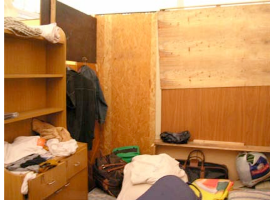
Intérieur de sa chambre avec des murs de fortune

passeport, cela ne sert à rien, ce qui compte c'est le permis de séjour. Ici, on doit attendre plus ou moins trois ans, entre chaque Sanatoria, pour avoir le droit de demander le permis de séjour. J'ai manqué la dernière Sanatoria, et donc, pendant trois ans, je suis obligé d'être illégal.