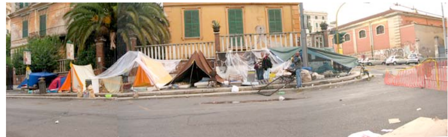
Panorama des tentes dans le paysage urbain

Les immigrants restent vigilants après une semaine passée dans la rue et deux personnes envoyées à l'hôpital et un en prison, mais ils sont contents. Ils auraient accepté n'importe quoi pour avoir un toit sur la tête.