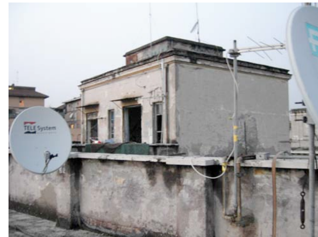
Toit de l'occupation de Porto Fluviale, Rome

chambres de 3 lits. Il y a la Rome des immigrés économiques, en situation régulière, qui doivent occuper des postes qui ne valorisent pas leurs compétences, ayant souvent un diplôme étranger non reconnu en Italie. Il y a la Rome des immigrés qui doivent se lever à 5h du matin pour prendre les boulots dont les Italiens ne veulent pas. Il y a la Rome qui abandonne ses bâtiments, délaisse son patrimoine habitable que les associations de lutte pour le logement récupèrent et occupent ensuite afin de faire bouger le gouvernement et d'obtenir des changements dans le droit au logement. Il y a la Rome où l'illégal et le toléré se côtoient, les centres sociaux par exemple, bâtiments occupés frauduleusement, mais proposant des activités diverses pour le quartier, donc tolérés par la commune. Il y a la Rome des occupations où les gens vivent dans des conditions précaires, en attendant et espérant mieux, au terme d'une lutte qui prend leur temps sans compter.