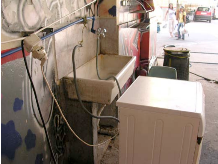
Machine à laver dans la cour de l'occupation

essayent de me rassurer en m'assurant que "l'hiver dernier, les chauffages étaient branchés, et le courant sautait lorsque l'électricité était trop sollicitée, il ne fait pas s'en faire, ça fonctionne."