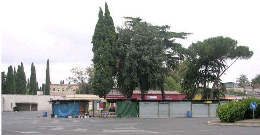
Echoppes fermées pour tout le mois d'août sur une place de Rome.