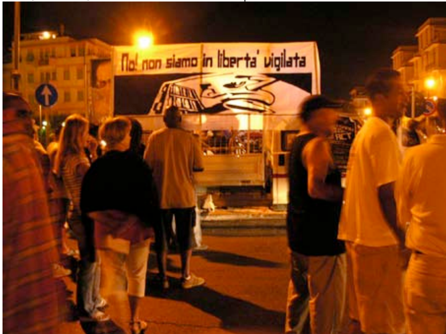
« Non ! Nous ne sommes pas en liberté conditionnelle » à la manifestation d'Ostie

En réaction à ces actes est organisé une manifestation, samedi 6 août, à Ostie, devant le Vittorio Occupato.