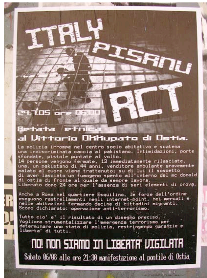
Affiche pour la manifestation en réponse au paquet Pisanu

A Rome, dans le quartier de l'Esquilin, les forces de l'ordre enchaînent les "ratissages" dans les centres-internets, les marchés, les habitations, arrêtant des dizaines de citoyens immigrés. But déclaré: opération anti-terroriste.